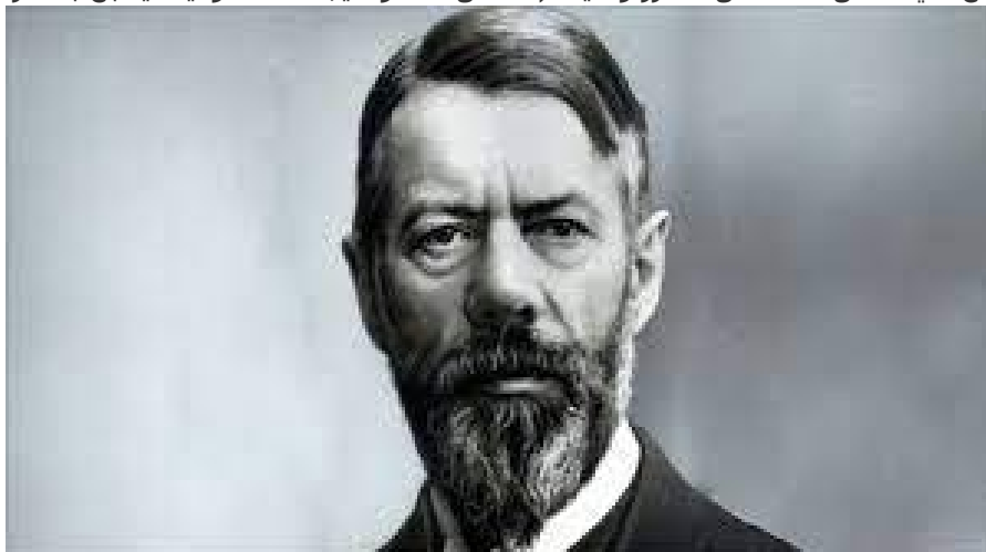
صورة ماكس فيبر

وفقدان الإبداع في العمل لأنه عمل متكرر ولا يعلم العامل ما هو نتيجة عمله وكيف يصبح بعد تركيبه.