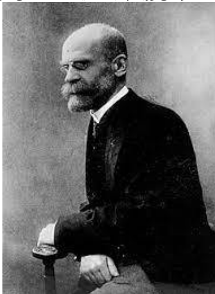
صورة إميل دوركايم