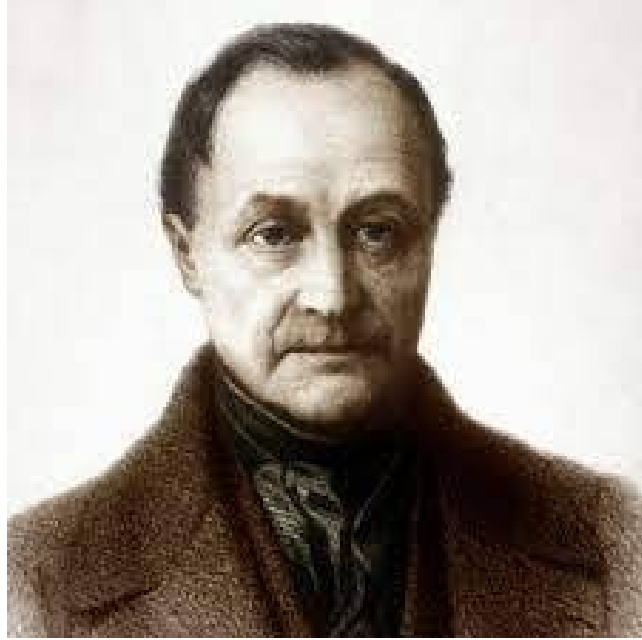
صورة لأوغست كونت

ابتداء من منتصف القرن 19 اصبح لعلم الاجتماع مكانة بين العلوم الأخرى، ويرجع الفضل إلى هذا إلى ظهور عدد كبير من المفكرين والباحثين الذي ظهوروا في مختلف مناطق العالم وسموا برواد علم الاجتماع وسوف نقدم عينة من هؤلاء الرواد الذين سعوا إلى تجسيد علم الاجتماع على ارض الواقع من خلال أبحاثهم ومساهماتهم.