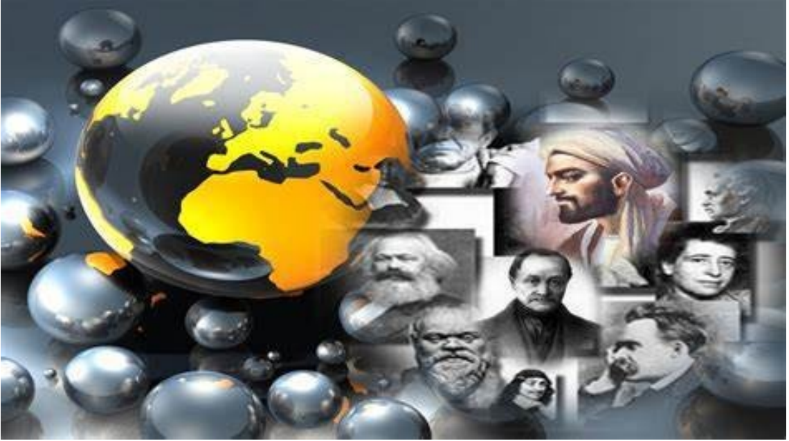
صورة لمدخل الى علم الاجتماع

بالرغم من أن التفكير العلمي بالنسبة للظواهر الاجتماعية لا يرجع إلى عهد بعيد، فإن المسائل التي تتعلق بحياة المجتمع ظلت تشغل عقول المفكرين منذ أزمنة بعيدة، هناك الكثير من الباحثين السوسولوجيين من يرجع الدراسات الاجتماعية إلى أصول تاريخية ، فمنهم حتى من الغرب خلافا على العرب الذين يهتمون بتاريخ علم الاجتماع يرجعونه للعلامة ابن خلدون ، الذي عرف بعلم الاجتماع البشري أو العمران البشري ، و آخرون يرون أن العالم الإيطالي فيكو هو الأب الحقيقي لعلم الاجتماع، إلى أن كونت فرض نفسه أيضا باعتباره هو من أطلق المصطلح الحديث على هذا العلم ( السوسولوجي) لذلك وجب علينا أن نقف على حقيقة هذا العلم و أيضا الإجابة على الأسئلة التالية : ما علم الاجتماع ؟ و ما موضوعاته ؟ و من هم رواده؟