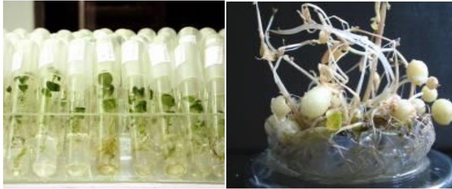
Figure 2: Exemple de la pomme de terre: applications industrielles depuis près de 20 ans