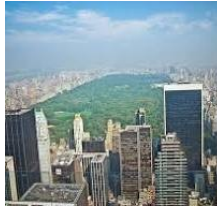
صورة البيئة الحضرية

وهي تشمل الجوانب الاجتماعية والجوانب الفيزيكية المصنعة والطبيعية كلها تشكل مايسمى بالبيئة الحضرية