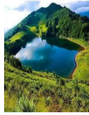
صورة البيئة الطبيعية