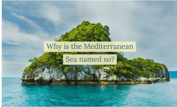
تسمية البحر المتوسط

سُمي بهذا الاسم نتيجة لتساعده، إذ تظهر مياهه بلون فاتح شبيه بمياه المحيطات الكبيرة عند الإبحار فيه، وجاء وصفه بالمتوسط نتيجة توسطه بين قارة أوروبا شمالاً وقارتي إفريقيا وآسيا جنوباً وشرقاً [2]. وليس من السهل تحديد مفهوم البحر الأبيض المتوسط فهو يشكل معطى وواقع جيوسياسي حضاري ثقافي وتاريخي في آن واحد. فهو كتلة مائية كبيرة جعلت منها الجغرافيا منطقة وسط والتقاء لأهم قارات العالم، أوروبا شمالاً وآسيا شرقاً وإفريقيا جنوباً وجميعها يطل على ضفاف هذا البحر ومن هنا جاءت تسمية المتوسط، بمعنى أنه يتوسط ثلاث قارات، وهو بذلك يتوسط الأرض. وكلمة البحر الأبيض المتوسط مشتقة من كلمتين لاتينيتين: Médius والتي تعني المتوسط terra أي الأرض وهي تعني بذلك البحر الذي يتوسط الأرض أو البحر المتوسط. وهو بذلك يتوسط الأرض وليس من السهل تحديد مفهوم البحر الأبيض المتوسط فهو يشكل معطى وواقع جيوسياسي حضاري ثقافي وتاريخي في آن واحد.