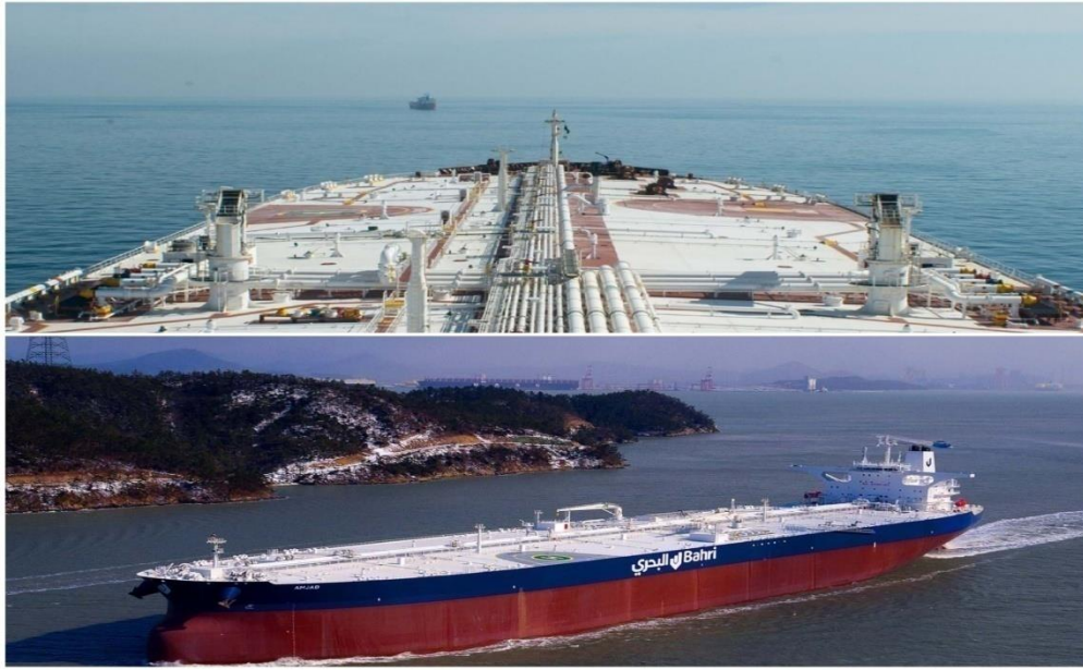
سفينة نقل النفط