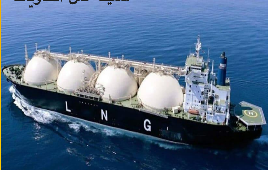
سفينة نقل الغاز المسال