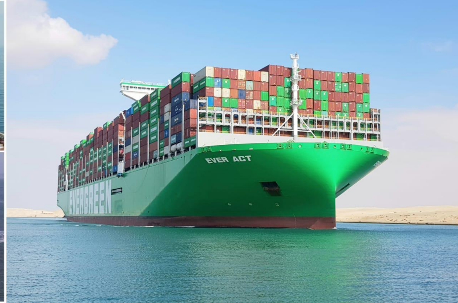
سفينة نقل الحاويات