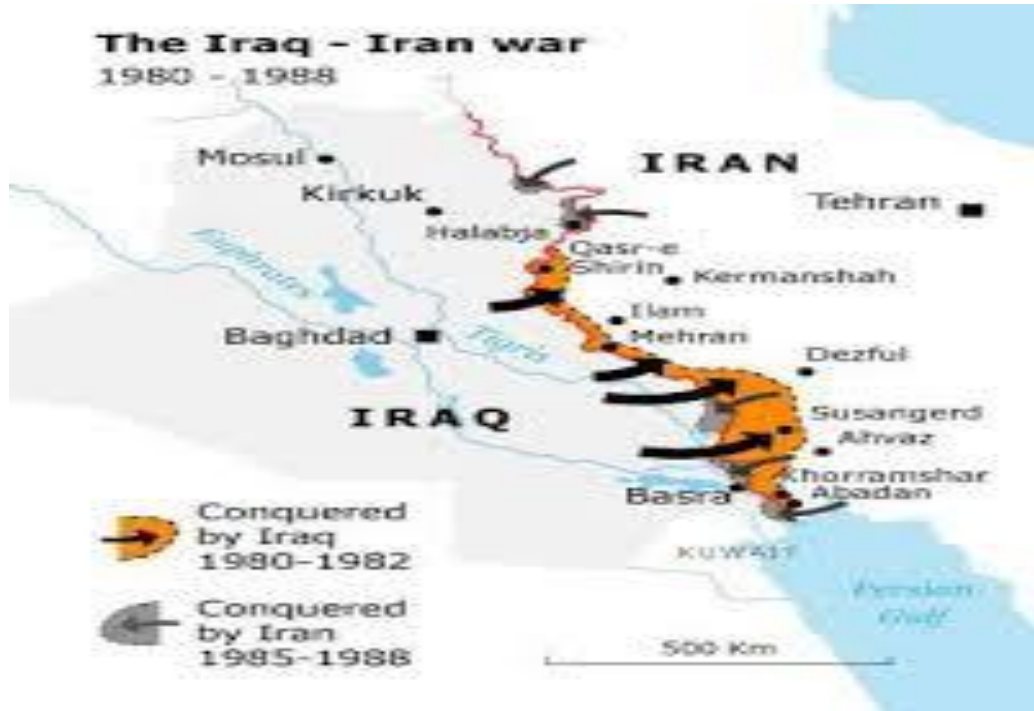
خريطة شط العرب المتنازع عليه بين العراق وايران في الحرب بين 1980-1988