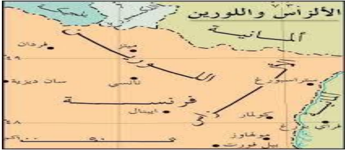
خريطة الألزاس واللورين المتنازع عليها تاريخياً بين فرنسا وألمانيا

-الحدود المفروضة/الاستعمارية: تم فرضها من قوى خارجية وغالباً ما تقطع مناطق متكاملة (مثل الحدود في إفريقيا).