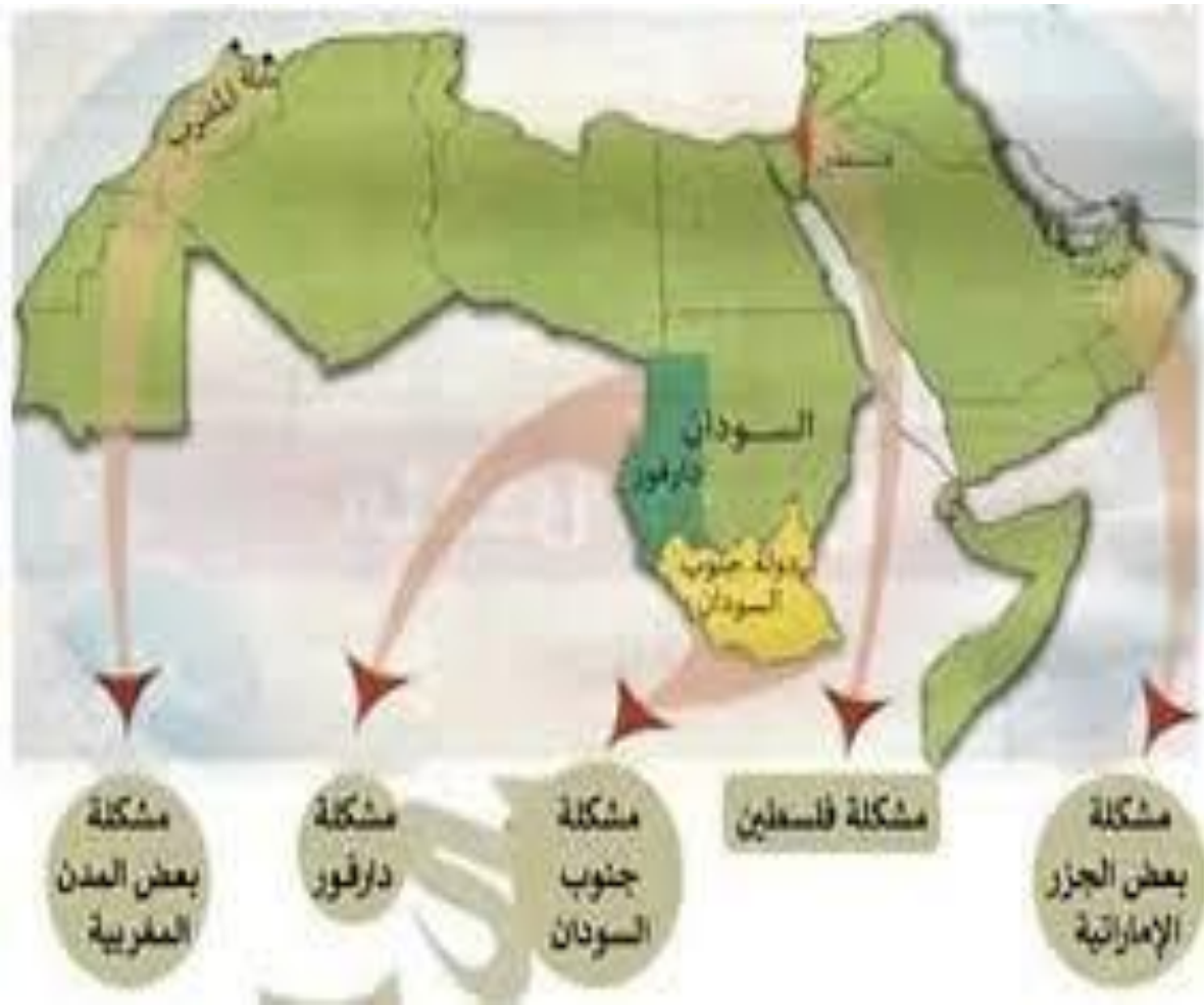
خريطة بعض مشاكل الحدود في الدول العربية