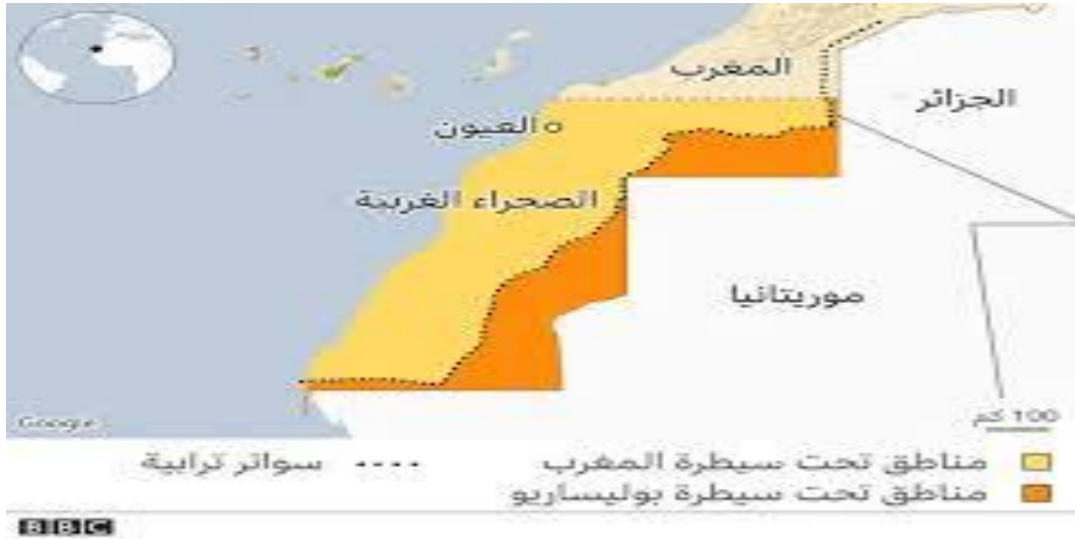
خريطة أجزاء الصحراء الغربية المحررة والمحتلة من طرف المغرب