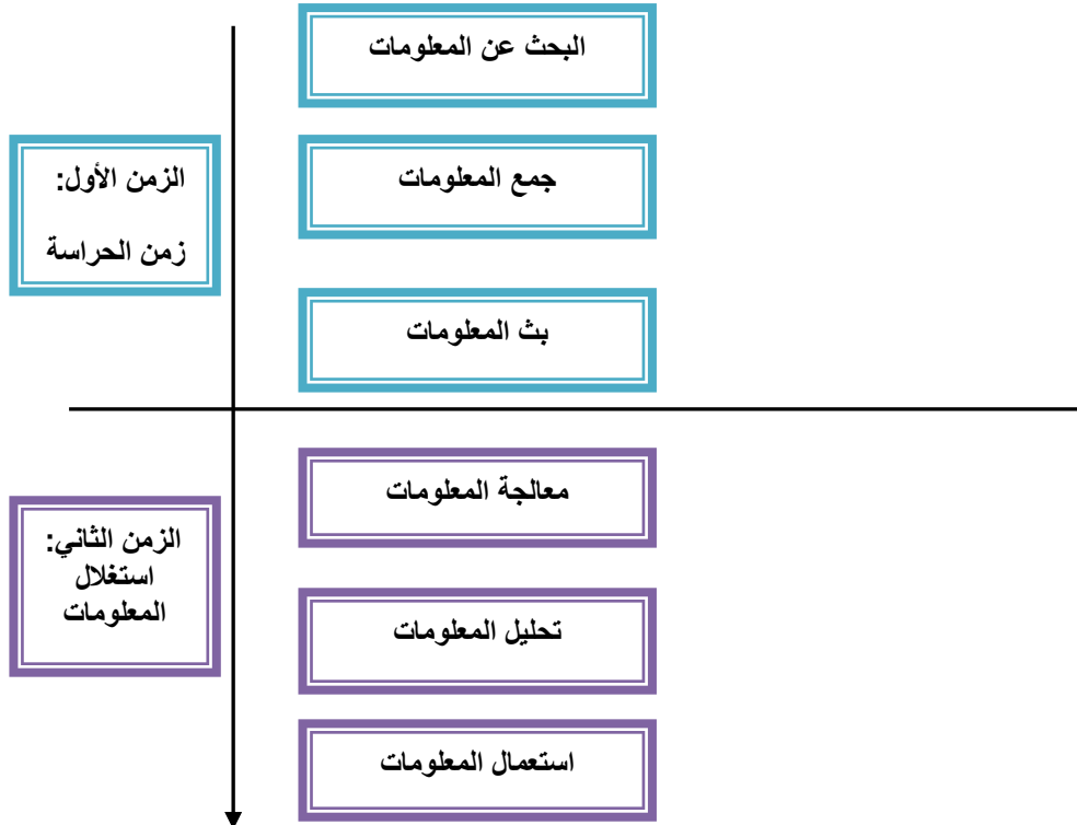
شكل يوضح: نموذج الزمنيين للبقطة الإستراتيجية لـ Gerarld VERNA

3-2/ عملية استعمال المعلومات: حتى تكون القرارات المتخذة في المؤسسة أكثر رشادة و عقلانية، يجب أن يكون هناك التوظيف العلمي و العملي للمعلومات التي تم تثبيتها، في عملية اتخاذ القرار، و الغاية الرئيسية من وراء ذلك هو تحسين السلوك الاستراتيجي للمؤسسة.