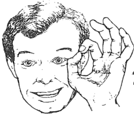
الشكل (٢) كل شيء حسن!

والصورة الموائية توضح إيماءات عالمية يفهمها كل الناس مثل حلقة الأصابع التي تعني جيد أو موافق أو حسنا أو أوكي، أما إيماءة هز الكتفين تعني أنه لا يفهم ما تتحدث عنه وأيضا اليدان البرجيتان.