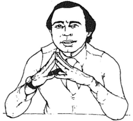
الشكل (٤٢) اليدان البرجيتان

ثا - وضعية جسد المفاوضات: بمعنى وضعية واتجاه محدد لأجزاء الجسم، حيث يعد الرجوع للوراء إشارة على رفض عملية الاتصال، أما الانحناء الجزء العلوي من الجسد إلى الأمام يدل على الاستجابة والحماسة، كما أن وضع اليدين في الجيوب أو الجلوس ووضع القدمين فوق بعضهما ويأرجح أحدهما يكون انطباعا سلبيا عند الآخرين، وبشكل عام فإن الوقوف مستقيما، وشد الكتفين للخلف، ورفع الرأس وعدم طي الذراعين، يكون انطباعا جيدا عند الآخرين، ويقدم المفاوضات على أنه ذو قوة وثقة بالنفس.